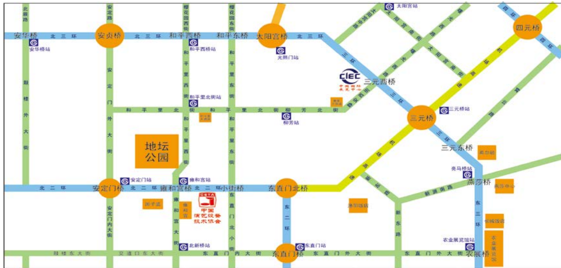
中国国际展览中心地理位置